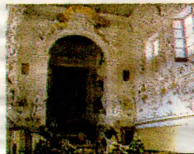
L'oratorio di Santa Cita